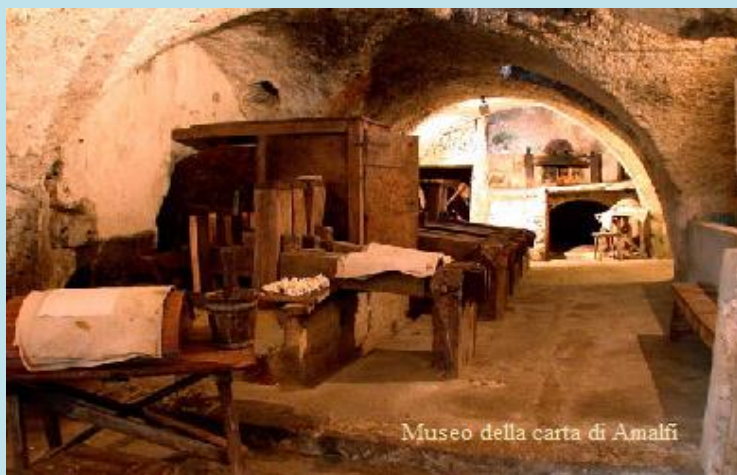
Museo della carta di Amalfi

Aula Magna Liceo "T. Tasso" 7 Marzo 2018 Piazza San Francesco, 1 – Salerno