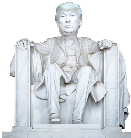
di Renato Perna IVD

più potente del mondo e di conseguenza, il presidente è l'uomo più potente del mondo. Probabilmente proprio per questa ragione, oggi Trump ci fa paura: è un uomo che può fare tutto, ma potrebbe non fare niente. Non sappiamo cosa farà, ma sappiamo bene che ciò ricadrà sul nostro Paese e sulle nostre vite. Appena gli Stati Uniti faranno un passo avanti saremo costretti a seguirli, nel bene e nel male, perché Donald J. Trump è il nostro presidente e siamo tutti statunitensi.